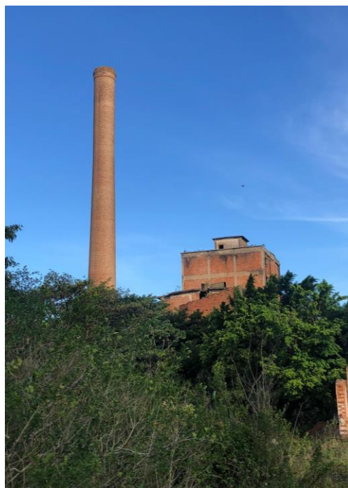
Anexo 8 e 9