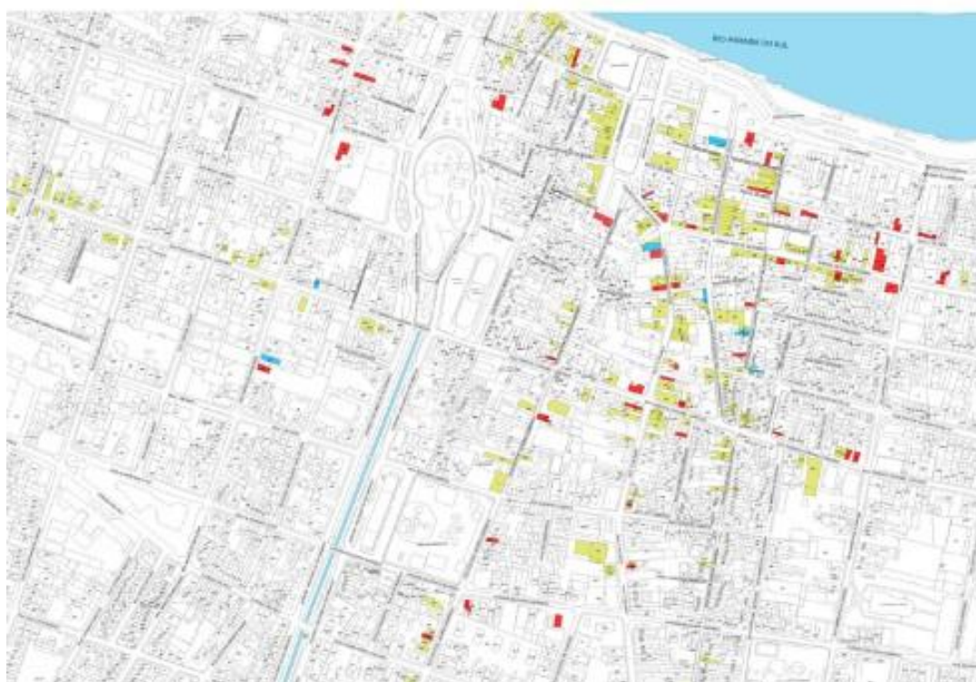
Imagem 03- Mapa do centro e adjacências de Campos dos Goytacazes na escala 1/2000

Assim sendo, ao término da pesquisa, foi atingida a meta de conseguir inventariar todos os imóveis tombados pelo coppam, somando em 386 fichas. Dentre elas 4 igrejas (Igreja de São Francisco de Assis, situada na Rua 13 de maio, Centro; Igreja de Nossa Senhora do Carmo, situada na Rua 13 de maio, Centro; Igreja de Nossa Senhora de Fátima, situada em Mussurepe; Igreja de São Gonçalo, situada em Goytacazes) 1 Mosteiro (Mosteiro de São Bento e Cemitério, ambos situados em Mussurepe) 1 busto (Busto de nilo peçanha localizado na praça Barão do Rio Branco) e 1 coreto (Coreto da Igreja São Benedito, Jardim de São Benedito;).