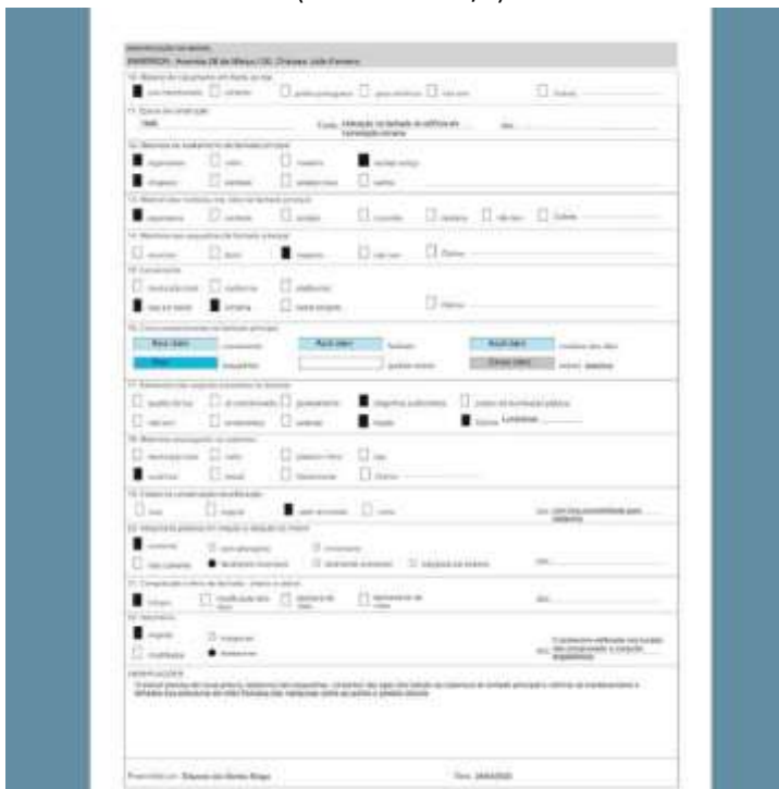
(Post criado - 5/5)