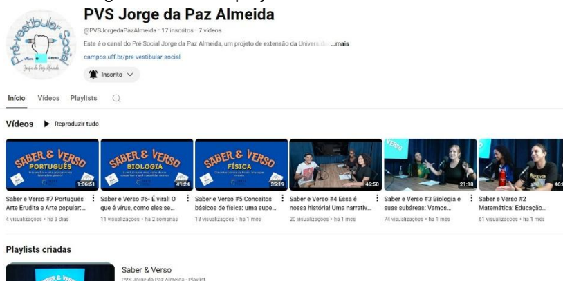
Figura 1 - Canal do projeto de extensão no Youtube

É importante destacar que a já citada greve nas universidades federais, as eleições municipais e outros eventos impactaram o cronograma, resultando na impossibilidade de gravar todos os episódios planejados. Além disso, uma meta importante, que era realizar uma pesquisa de opinião com o público-alvo, não pôde ser concretizada devido às limitações impostas por esses acontecimentos. Apesar disso, o projeto alcançou resultados significativos e reforçou a relevância do podcast como ferramenta pedagógica e de extensão.